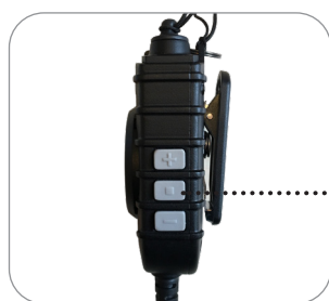
Lautstärkeregler +/- und Stummtaste (optional für Lautsprecher oder Mikrofon)

ist eine sehr vielseitige Zubehörlösung. Mit den handschuhtauglichen Tasten und der Schutzklasse IP67 eignet es sich ideal für den harten Einsatz bei Behörden oder in der Industrie. Mit seiner Nexus-Klinkenbuchse ist es für eine Vielzahl von Audiozubehör geeignet.